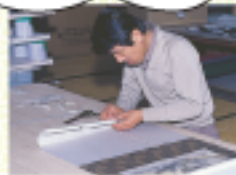
仕上げ 巻帯・半巾・周帯・執巻つけます。 商品に表情を持って丹念に仕上 げます。