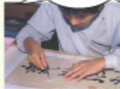
補修 やぶれた折れ等巻丹念につくるい ます。