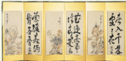
表装後 新品同様のきれいさと重厚さを 併せもった屏風。