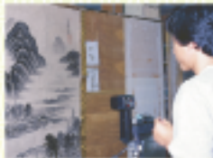
写真撮影 作品を間違えないように写真 撮影をします。

国家資格を持った一級表具技能士の 一点一点心をこめた表具でお宝が 蘇ります。是非ご利用下さい。