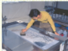
しみぬき ベテラン表具師が入念に本紙の よごれしみ等をとりず。